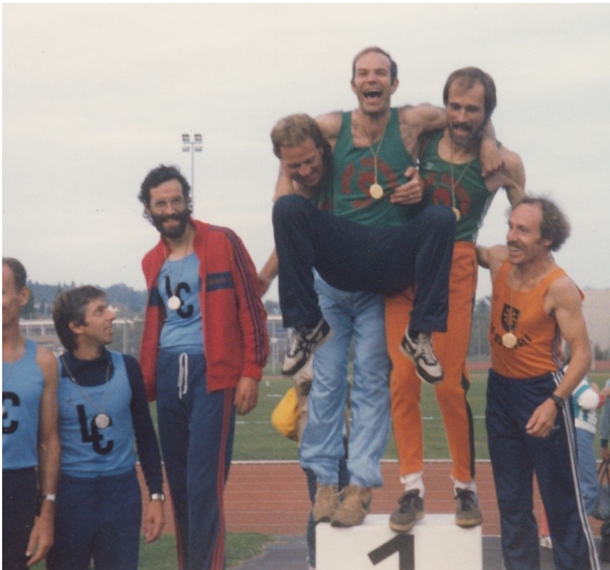
Abb. 30 : die ASV-Oldies nach der Siegerehrung in Radolfzell