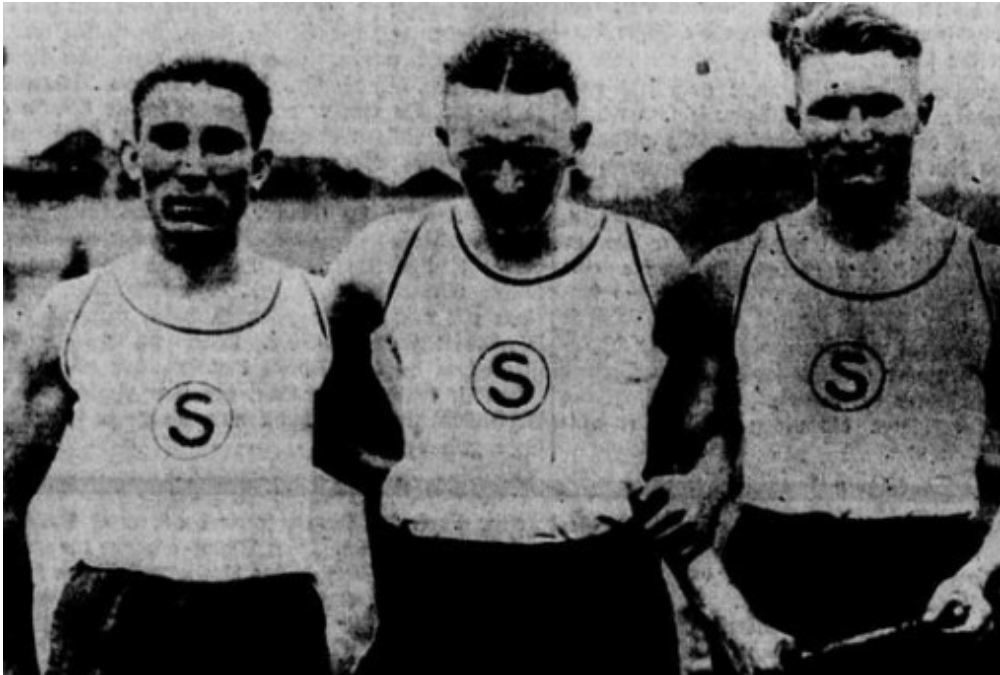
Abb. 6 : die 3 x 1000 m-Staffel der Polizeischule Bonn als Rheinland-Meister (Bonner General-Anzeiger vom 30.6.1930)